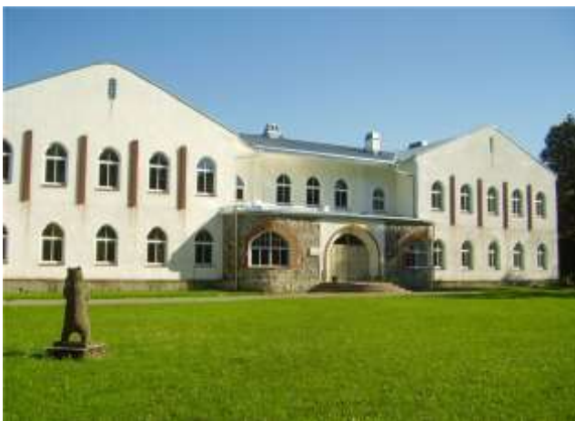
Joonis 7. Vändra Gümnaasiumi A-korpuse hoone tänapäeval. (Vändra Gümnaasium, s.a.)

Tänaseks on Põhja-Pärnumaa volikogu ja vallavalitsus tellinud ümberehitusprojekti õpilaskodu hoonele. Eesmärgiks on kujundada esimese ja teise korruse ruumidest õppeklassid ning vajalikud ruumid muusikakooli jaoks. Tegemist on ainult projektiga ja ehituslikku tegevust veel planeeritud ei ole (vt lisa 3).