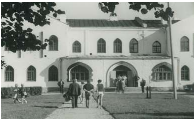
Joonis 5. Vändra Keskkool.

Alljärgnev foto (joonis 5) on 1960. aastate koolimajast.