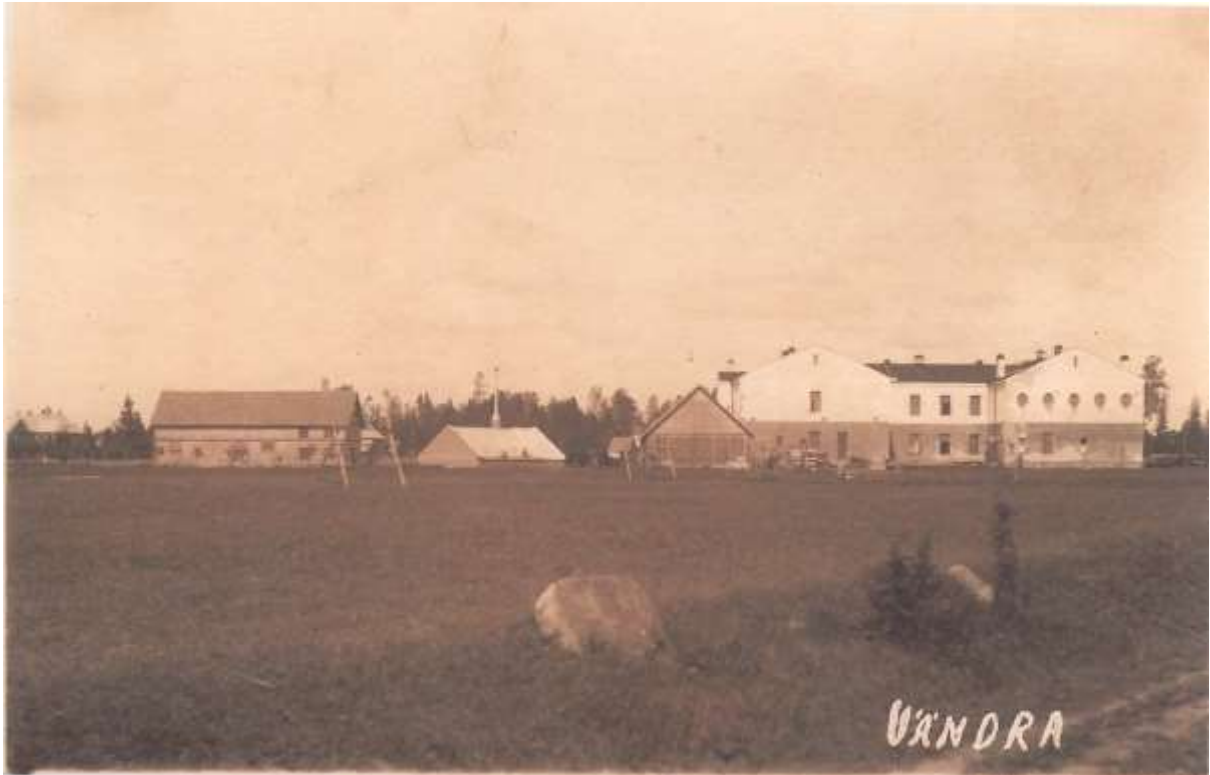
Joonis 4. Koolimaja tagantvaates.

Alljärgnev foto (joonis 4) on tehtud ilmselt selle peatüki ajajärgul. Fotol on näha (paremalt vasakule) koolimaja, puukuur, kasvuhoone ja majandushoone.