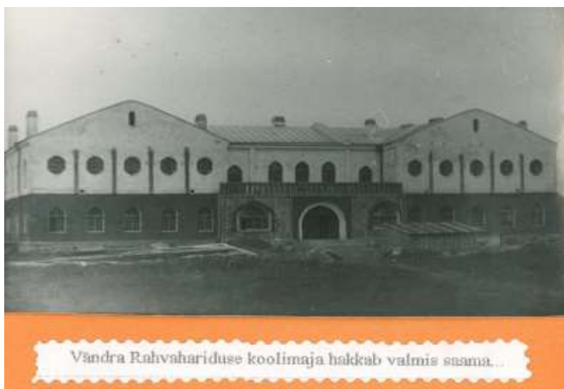
Joonis 3. Vändra Rahva Hariduse Seltsi koolimaja hakkab valmis saama.

Läbi raskuste jõudis koolimaja ehitus lõpule 1912. aasta sügiseks (vt joonis 3), lõplikuks maksumuseks 53 000 kuldrubla. Sisetööd jäid aga ettevõtja Mambergi poolt tegemata, kuna seltsil oli veel võlgugi, mis vajasid tasumist (Raidmets, 2017:70-72). Et koolimaja ehitus läks tunduvalt kallimaks ettenähtud eelarvest, olid talumehed sunnitud oma säästudega maksuma tagasi 35 000 rubla ulatuses võetud laenusummad. Võlgade tasumisega jäi koolimaja Vändra Rahva Hariduse Seltsile (Holsting, 1991:7).