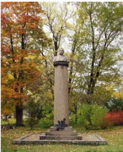
Joonis 6. Anton Jürgensteini ausammas Vändras (Tooming, s.a.).

Anton Jürgensteini 120. sünniaastapäeval, 1.novembril 1981, taasavati tema büst kooli ees vilistlaskogu esimehe Endel Kõutsi aktiivse tegutsemise tulemusena (vt joonis 6). (Raidmets, 2017:255), (Vikipeedia, 2018).