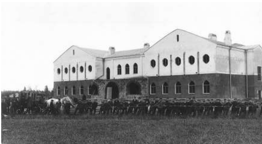
Joonis 2. Vändra Gümnaasium 1912, aurukatlavedu.

Läbi raskuste jõudis koolimaja ehitus lõpule 1912. aasta sügiseks (vt joonis 3), lõplikuks maksumuseks 53 000 kuldrubla. Sisetööd jäid aga ettevõtja Mambergi poolt tegemata, kuna seltsil oli veel võlgugi, mis vajasid tasumist (Raidmets, 2017:70-72). Et koolimaja ehitus läks tunduvalt kallimaks ettenähtud eelarvest, olid talumehed sunnitud oma säästudega maksuma tagasi 35 000 rubla ulatuses võetud laenusummad. Võlgade tasumisega jäi koolimaja Vändra Rahva Hariduse Seltsile (Holsting, 1991:7).