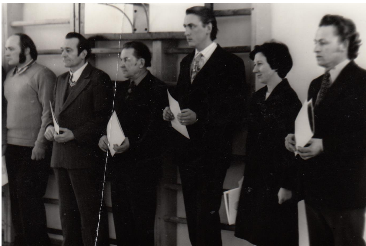
Joonis 2. Võimla avamine 1978

1978/79. õppeaastal oli esimene aasta uues võimlas. Spordielus oli näha langust, sest poisid läksid peale põhikooli lõpetamist kutsekoolidesse ja tüdrukute seas muutus sport vähem tähtsaks. Sportimine jäi vahepeal pausile, sest talve -40 kraadini ulatuvad ilmad tegid võimla küttesüsteemile viga. Töö jätkus alles veebruaris.